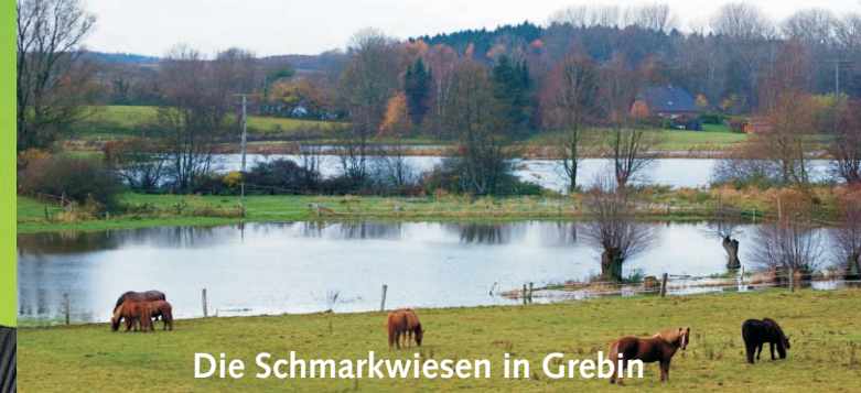
Die Schmarkwiesen in Grebin